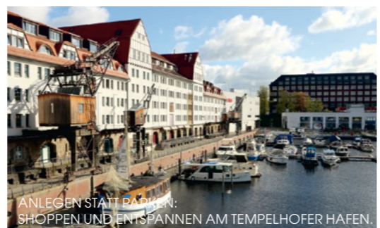
ANLEGEN STATT PARKEN: SHOPPEN UND ENTSPANNEN AM TEMPELHOFFER HAFEN.

65/50 MRC Berlin Boot: TeK, km 18,5 LU ! am Südufer des Teltowkanals in einem eigenen kleinen Hafenbecken, vor Schwell aus dem Kanal geschützt 1 k.A./k.A./k.A. 1 €/m, Duschen 2 €, Strom 2 €, Waschmaschine 2,50 €, Wasser 1 €/100 l 2 km Crew: WC Versorgung: 1 km Lage: 0,3 km Teltowkanalstraße 16, 12247 Berlin (0 30) 76 80 29 16 hafen@mrc-berlin.com www.mrc-berlin.com